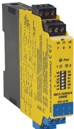
Centralina EXI/2 EXI/2 Panel

Ripetitore Per Barra DIN a Doppio Canale Indipendenti, Ogni Canale Permette di Controllare un Carico in Area Sicura Tramite un Regolatore LITTLE EX in Area Pericolosa.